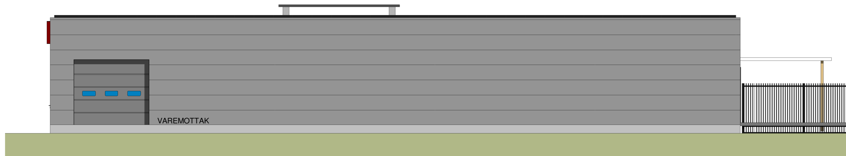
Fasade NV 1 : 100