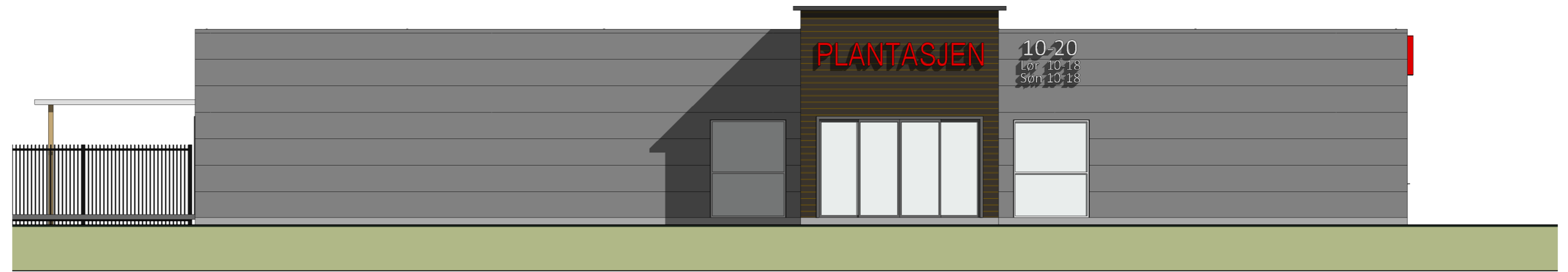
Fasade SØ 1 : 100